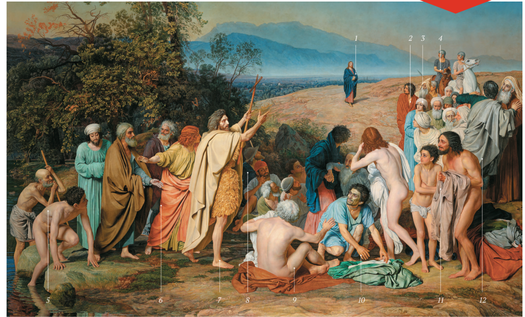
Александр Иванов. «Явление Христа народу».

Когда Христос стал выходить из воды, произошло чудо — в видимых и доступных для понимания образах людям явилась вся Пресвятая Троица: Бог Отец в виде голоса из отверстых небес, Бог Дух Святой в