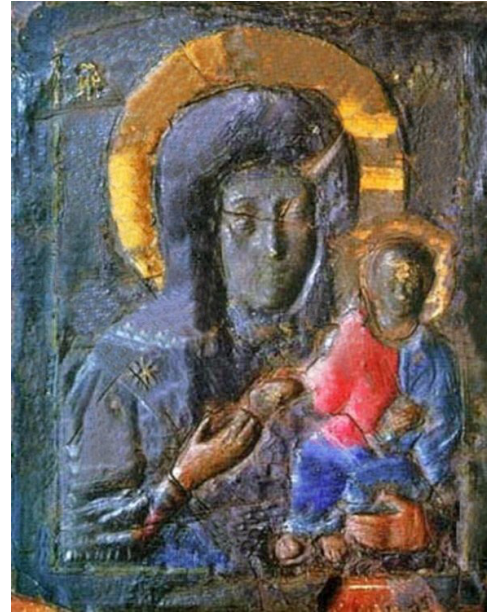
Влахернская икона Божией Матери была привезена в дар царю Алексею Михайловичу. Хранится в Третьяковской галерее. Влахернская церковь Богородицы не сохранилась

анского миссионера. Воинственным варягам стало интересно: что же это за Бог у греков, способный разметать сильнейшее войско? Некогда воинственные язычники-варвары, Аскольд и Дир к концу жизни приняли Крещение, крестились и многие из их дружинников.