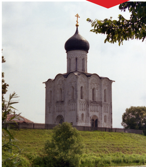
Церковь во имя Покрова Пресвятой Богородицы на Нерли построена князем Андреем Боголюбским

Праздник Покрова Пресвятой Богородицы, традиционно считается днем свадеб. Венчание на Покров воспринимается чем-то вроде гарантии счастливой семейной жизни. Однако на самом деле это чисто народное представление. Церковного смысла и обоснования оно не имеет,