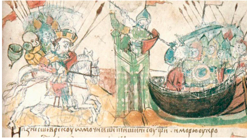
Дружина Аскольда и Дира осаждают Царьград. Радзивилловская летопись

тийской столицы оправданно ждали, что уже к утру они могут проститься с жизнью.